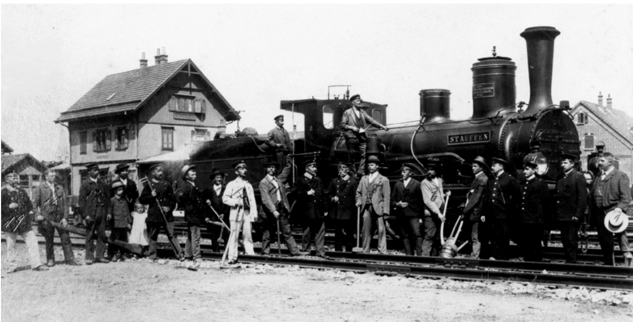
6. Lokomotive „Stauffen“ mit Eisenbahnarbeitern am Münsinger Bahnhof. Die Aufnahme entstand vermutlich im Zuge der Fortführung der Eisenbahnlinie bis Schelklingen 1901

1893. Ein Freudenjahr für Münsingen. Nach zweijähriger Bauzeit wird am 1. Oktober des Jahres die Bahnstrecke Honau-Münsingen feierlich in Betrieb genommen. Münsingen ist die letzte Oberamtsstadt im Königreich Württemberg, die einen Eisenbahnanschluss erhält. Alledem waren hitzige Diskussionen über die Streckenführung vorausgegangen. Am Vortag der Streckeninbetriebnahme fährt der erste Zug mit Lok „Achalm“ in den Münsinger Bahnhof ein. Das Ereignis wird mit Böllerschüssen und Klängen der Stadtkapelle begleitet. Ein Festzug mit Angehörigen von Ortsvereinen zieht durch die bekränzten und beflaggten Münsinger Straßen. Festreden und Hochrufe im Gasthaus zum Ochsen loben das Werk und ehren die am Bahnbau Beteiligten. Und tatsächlich mausert sich die Eisenbahn zum Motor moderner Entwicklung. Das neuzeitliche Verkehrsmittel ebnet nicht nur den Weg für die Errichtung eines Truppenübungsplatzes ab 1895 sondern auch für die Ansiedlung eines Zementwerkes am Hungerberg 1897.