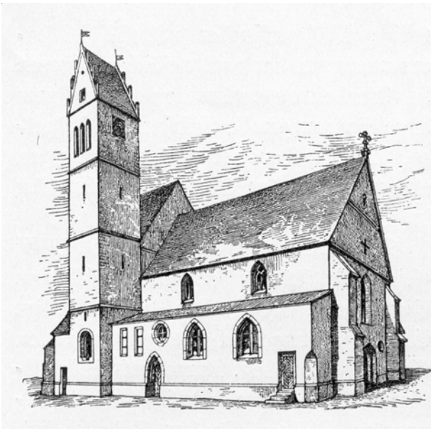
4. Die Münsinger Martinskirche vor der Turmerneuerung 1887

Doch kehren wir von der Landesgeschichte zurück nach Münsingen. Die Stadt gedeiht, die finanziellen Möglichkeiten ihrer Bürger sind so gut gestellt, dass ein Umbau der Martinskirche im gotischen Stil in Angriff genommen werden kann. Arbeiten am Glockenstuhl Ende der 1480er Jahre läuten umfassende Bauarbeiten für eine Neugestaltung des Gotteshauses im gotischen Stil unter dem befähigten Baumeister Peter von Koblenz ein, die kurz vor 1500 ihren Abschluss finden.