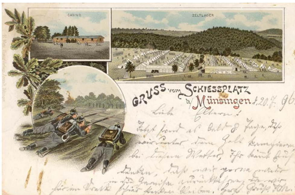
7. Ansichtskarte des „Schießplatzes Münsingen“ aus dem Jahr 1896

zweitägiges Gefechtsschießen ein. Der erfolgreichen Übung folgt im kommenden Jahr zunächst die Errichtung einer Zeltstadt und dann der Ausbau zu einem Militärlager bei Auingen. Damit beginnt die Erfolgsgeschichte des Truppenübungsplatzes Münsingen. Ganze Heerscharen junger Männer gelangen in den kommenden Jahrzehnten als Soldaten nach Münsingen und absolvieren hier ihre Ausbildung. Münsingen ist gehasst und geliebt zugleich. In der Erinnerung verbleiben unglaubliche Strapazen, Regen und klirrende Winterkälte, aber auch die unvergessliche Kameradschaft mit Leidensgenossen. Münsingen und Auingen können von den anwesenden Soldaten nur profitieren. Das Auinger „Alte Lager“ sowie das ab 1915 östlich von Münsingen erbaute „Neue Lager“ sind verlässliche Garanten neuzeitlicher Strukturentwicklung und beleben Wirtschaft und soziales Gefüge.