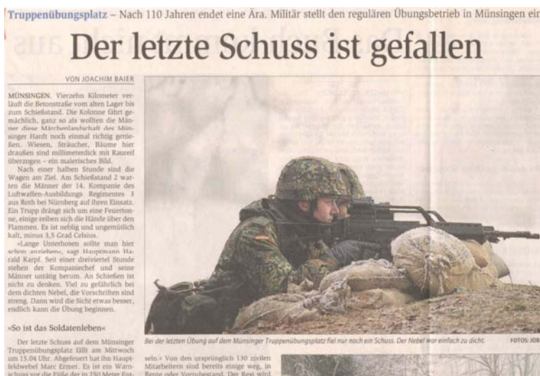
10. Einstellung des militärischen Übungsbetriebs: Zeitungsartikel des Reutlinger Generalanzeigers vom 10.12.2004

Die jüngsten Jahre bringen neuen Wandel. 2004/05 endet die über hundertjährige militärische Tradition Münsingens mit dem Abzug der Bundeswehr aus der Herzog-Albrecht-Kaserne . Doch wo alte Türen sich schließen, werden neue aufgetan. Mit Wirkung zum 22. März 2008 wird die Errichtung eines Biosphärengebiets Schwäbische Alb nach Landesrecht wirksam, das in seiner Kernzone den ehemaligen Truppenübungsplatz umschließt und eine das Gebiet von 29 Gemeinden umfassende Modellregion etabliert.