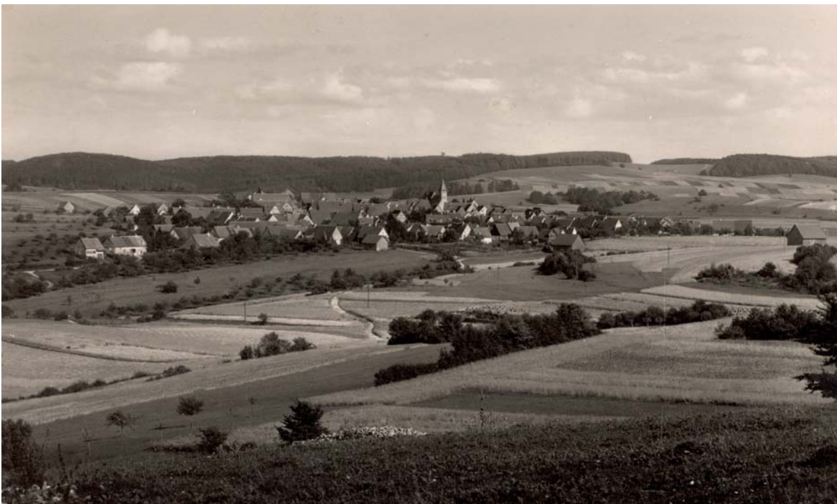
8. Dorfansicht Gruorns um 1935

Gruorn – ein Name, eine Legende. Für unzählige Jahrhunderte ein nicht so weit entfernter Nachbar der Stadt. 1937 dann ungläubiges Entsetzen: das Dorf soll geräumt werden. Bis 28. Februar 1939 müssen die Bewohner verschwinden. So will es die nationalsozialistische Reichsregierung. Die Äcker und Felder der Bauern werden für eine Erweiterung des Truppenübungsplatzes benötigt. Vielfache Bemühungen, das Dorf zu retten, scheitern. Die Gruorner werden für entstehende Verluste zwar entschädigt, doch sie verlieren ihre Heimat. Nach ihrer Umsiedlung steht das Dorf frei zum Beschuss. Kaum ein Stein wird auf dem anderen bleiben. Jahrzehnte später werden alte Gruorner beschließen, wenigstens Kirche, Friedhof und Schulhaus wieder instand zu setzen. Heute sind die Gebäude ein Mahnmal für die Vergänglichkeit, aber auch den menschlichen Irrsinn.