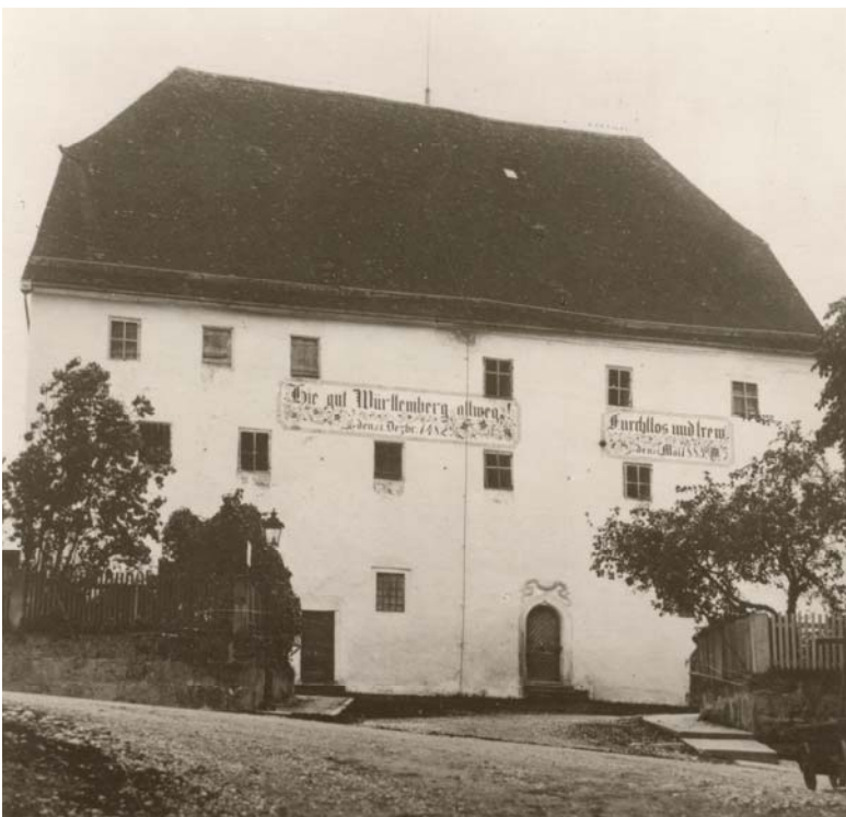
3. Voraussichtlich im Vorgängergebäude des sogenannten Alten Schlosses wurde der Münsinger Vertrag 1482 unterzeichnet. Hier eine Aufnahme des Hauses um 1910

Unsere Zeitreise führt uns weiter ins Jahr 1482 . Die politische Situation in Württemberg ist verworren. In Württemberg-Urach regiert mit Eberhard im Bart ein verständiger und kluger Herrscher, der allerdings bislang ohne rechtmäßige Erben ist. Württemberg-Stuttgart wird von den beiden Grafen Eberhard und Heinrich in Atem gehalten; ihr Landesteil ächzt nach kostspieligen Kriegszügen und prunksüchtiger Machtentfaltung unter erdrückenden Schulden. Doch damit nicht genug: der Tod geht um in Württemberg. Die Pest fordert ihre Opfer unter den Menschen. Wer wird wohl der Nächste sein? Nackte Angst ums Überleben, und das in mehrfacher Hinsicht, mag die beiden Grafen Eberhard den Älteren von Württemberg-Urach, genannt im Bart, und Eberhard den Jüngeren von Württemberg-Stuttgart nach Münsingen geführt haben. Hier oben, abseits des Weltengetümmels, wähnt man sich sicher vor dem Schrecken der Pest.