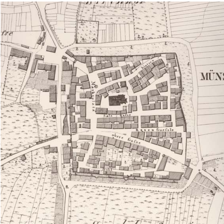
5. Stadtplan der Stadt Münsingen aus dem Jahr 1820 mit dem Siedlungsbestand vor Abbruch der mittelalterlichen Stadtbefestigung

Jahre später sprengt Münsingen seine alten Ketten. Zu Beginn der 1820er Jahre ist das Städtchen noch immer in seine Stadtmauern eingezwängt. Der nahezu quadratische Stadtgrundriss ist, von einer kleinen südwestlichen Vorstadt einmal abgesehen, seit 1500 unverändert geblieben. 1826 fallen dann die ersten mittelalterlichen Wehranlagen: der obere und untere Torturm sowie das sogenannte „Vichentor“ verschwinden, die Stadtmauer wird dann in den Folgejahren beseitigt oder durch vorangestellte neue Gebäude verbaut. Doch Münsingens Aufschwung erfolgt langsam und allmählich, denn noch immer ist die Stadt weit entfernt von den wirtschaftlich florierenden Ballungszentren, angebunden über schlechte Straßen an den Rest der Welt.