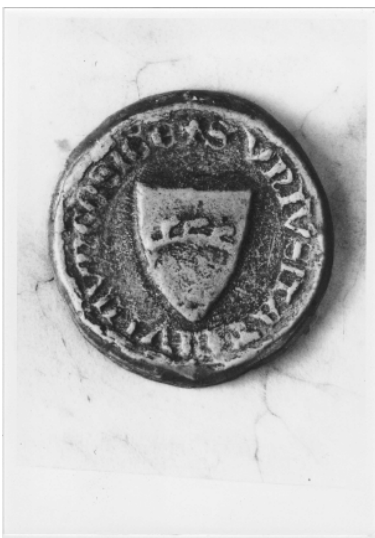
2. Ältestes Münsinger Stadtsiegel von 1339

Die Zugehörigkeit Münsingens zur württembergischen Grafschaft sollte dem Ort mal gut, mal schlecht bekommen. Zumindest ist den Herren an einem starken Stützpunkt Münsingen gelegen, denn das schwäbische Örtchen liegt in südlicher Grenzlage Württembergs – potentiell bedroht und daher schutzbedürftig. Wohl vorrangig deshalb erhält Münsingen bis spätestens 1339 Stadtrechte: die Stadt erhält ein eigenes Siegel ebenso wie die hohe Gerichtsbarkeit mit Blutgericht, Stock und Galgen. Auch das Marktrecht ist Teil der Rechtsverleihung. Im Gegenzug wird Münsingen die Pflicht auferlegt, sich mit Mauern und Türmen, Gräben und Toren zu umgeben. Für das damals auf 600 Einwohner geschätzte Gemeinwesen und die beteiligten Amtsorte eine große Bürde.