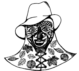
Hunderseng'r Stomba Spreng'r

Anträge und Anregungen können beim Vorstand Harald Eberhardt bis zum 9. April 2011 eingereicht werden.