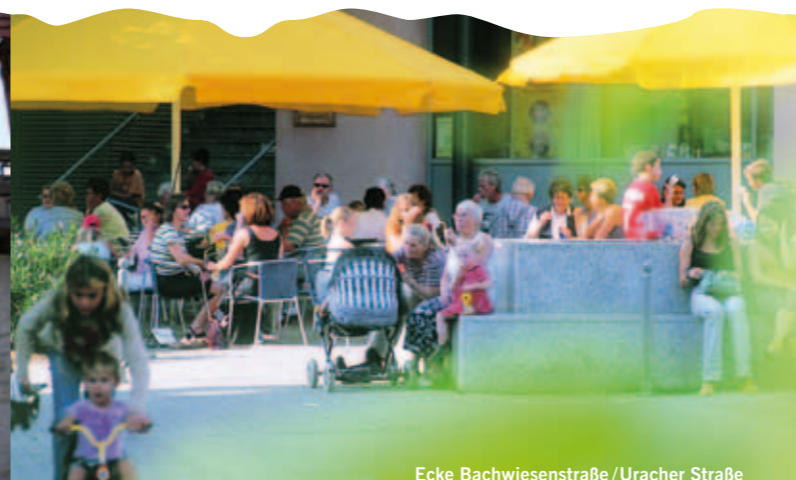
Ecke Bachwiesenstraße/Uracher Straße