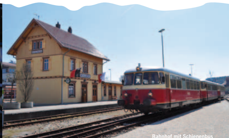
Bahnhof mit Schienenbus