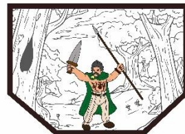
NV Waldschanz-Kelten e.V.