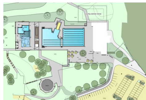
Historie des Münsinger Freibades