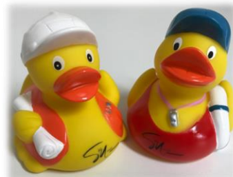
Bausteinaktion für das neue Freibad: Bade-Enten Bob Bademeister und Balduin Bau

Die Stadtverwaltung plant verschiedene Aktionen rund um das Marketing und Sponsoring der Baumaßnahmen. So können Sie als Baustein für das neue Freibad eine „Münsinger Bade-Ente“ erwerben. Der Erlös der Enten kommt direkt der Sanierung des Freibades zu Gute. Diese Enten können im Rathaus, im Freibad oder in der Tourist-Information für 5 EUR pro Stück gekauft werden.